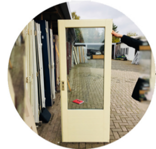
Deur - Porte - Door Raam - Fenêtre - Window Linteel - Linteau - Lintel Hergebruik - Réemploi - Reuse Gebrauktematerialen.com Croisade Pauvreté