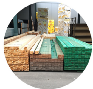
Dakstructuur - Structure de toit - Roof structure Isolatie - Isolation thermique - Insulation Overstock - Fin de stock - Unused Bouwstocks