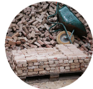
Bakstenen - Briques - Bricks Hergebruik - Réemploi - Reuse Franck