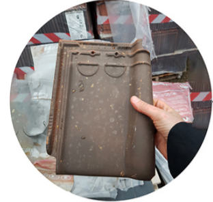
Dakpannen - Tuiles - Roof tiles Werfoverschot - Fin de stock - Unused Bouwstock

EN | The small building next to the visitor's pavilion houses the new toilets for the local youth movement and the visitors of the festival Breugel's Eye . The building was put up with materials sourced in three different ways: reused materials (salvaged from buildings slated for demolition), unused materials from other construction sites, and new materials. Less than a third (in kg %) of the materials used here are new. In the current building industry, reused and unused materials and components are only seldom used for new construction or renovation projects; both are usually reduced into as good as worthless rubble. This modest construction project wants to demonstrate things can be done differently.