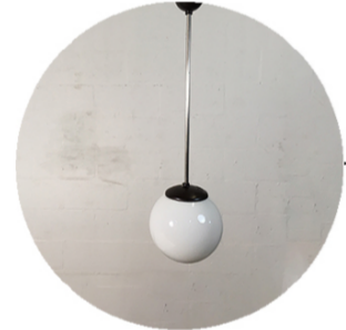
Armaturen - Luminaires - Light fixtures Hergebruik - Réemploi - Reuse RotorDC