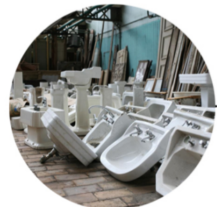
Sanitair - Sanitaire - Sanitary Hergebruik - Réemploi - Reuse RotorDC