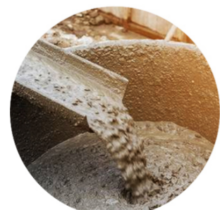
Beton - Béton - Concrete Nieuw - Neuf - New