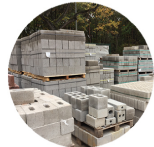
Betonblokken - Blocs en béton - Concrete blocks Isolatie - Isolation thermique - Insulation Werfoverschot - Fin de stock - Unused Bouwstocks