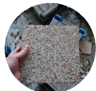
Vloertegels - Carrelage - Tiles Isolatie - Isolation thermique - Insulation Hergebruik - Réemploi - Reuse RotorDC Gebrauktematerialen.com